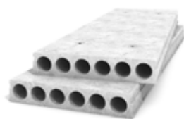
Huldæk: 25.500 m 2

Til dette projekt har Contiga produceret og monteret: